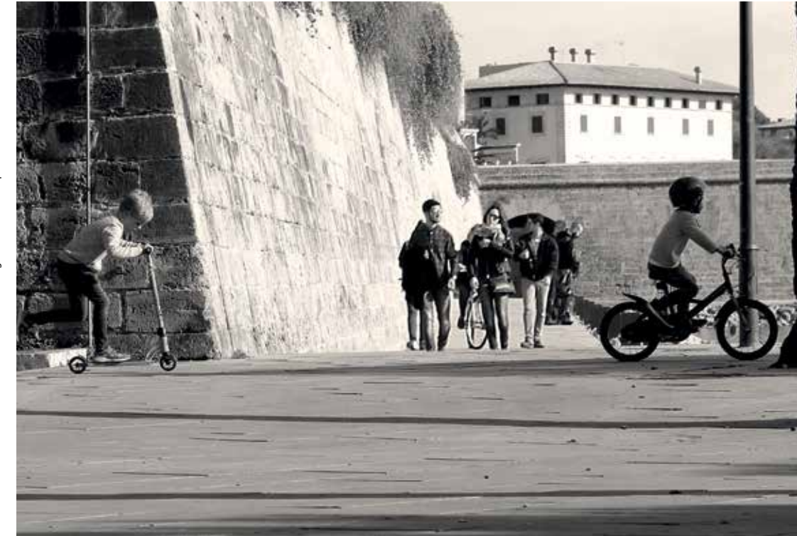
30 Palma Fotogràfica "Paviments i persones"